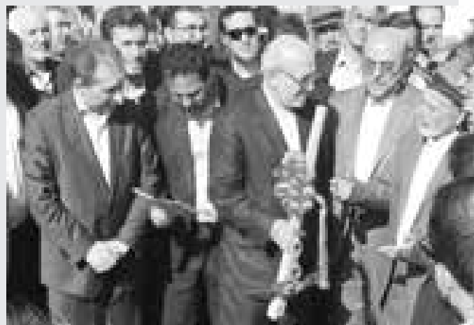
مراسم کلنگ‌زنی و عملیات اجرایی شرکت ایفای گستر مرنده با حضور وزیر

وی سرمایه‌گذاری این طرح را به ارزش ۳۵۰ میلیارد تومان اعلام کرد و گفت: این طرح قابلیت ایجاد شغل برای ۴۵۰ نفر به صورت مستقیم و در سه شیفت کاری را دارد. وی افزود: با توجه به ویژگی‌هایی که ایفای شیشه‌ای دارد، این محصولات می‌تواند جایگزین محصولات سنتی قرار گیرد.